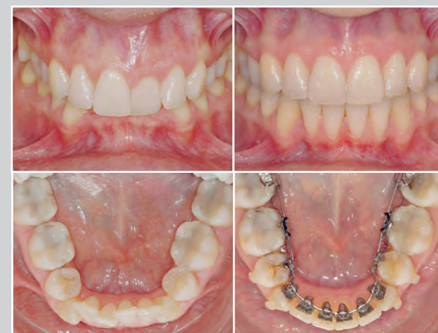
Endlich gerade Zähne: links jeweils das Gebiss vor der Behandlung, rechts bei Therapieende.

Interessierte können sich innerhalb einer unverbindlichen Beratung in der Aachener Klinik für Kieferorthopädie über die Möglichkeit und Dauer einer „lingualen“ Therapie informieren.