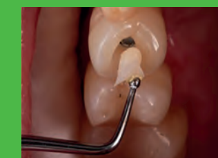
02 Zahnersatz im Seitenzahn-bereich