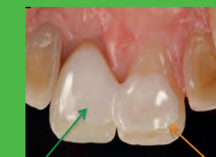
03 Zahnersatz im Frontzahn-bereich