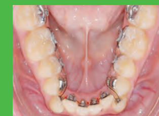
04 Dezentere Weg zum perfekten Lächeln